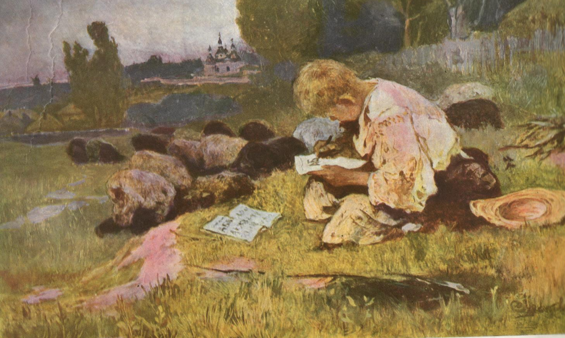
1827р. С. Їжакевич. Тарас Шевченко – пастух. Мені тринадцятий минало. Я пас ягнята за селом...