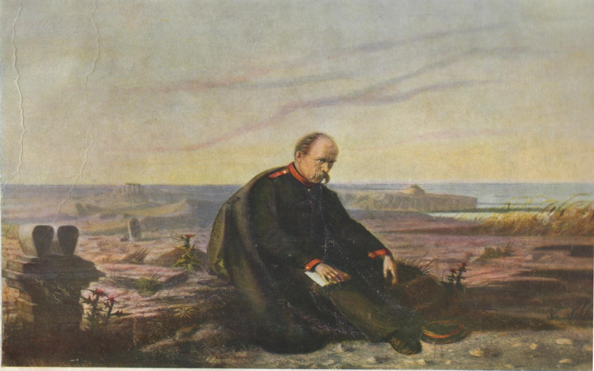
М. Устиянович. Т.Г. Шевченко на засланні.