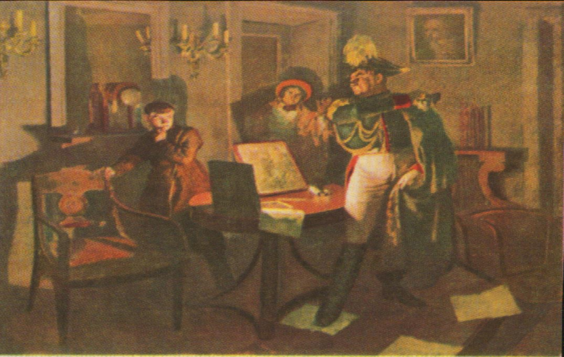
1829р. Великим драматичним напруженням насичена картина К. Трохименка “Поміщик Енгельгардт карає Тараса за малювання”