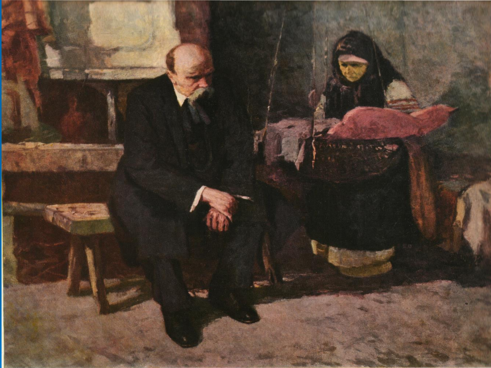
С. Гуєцького “Дума про кріпацьку долю”