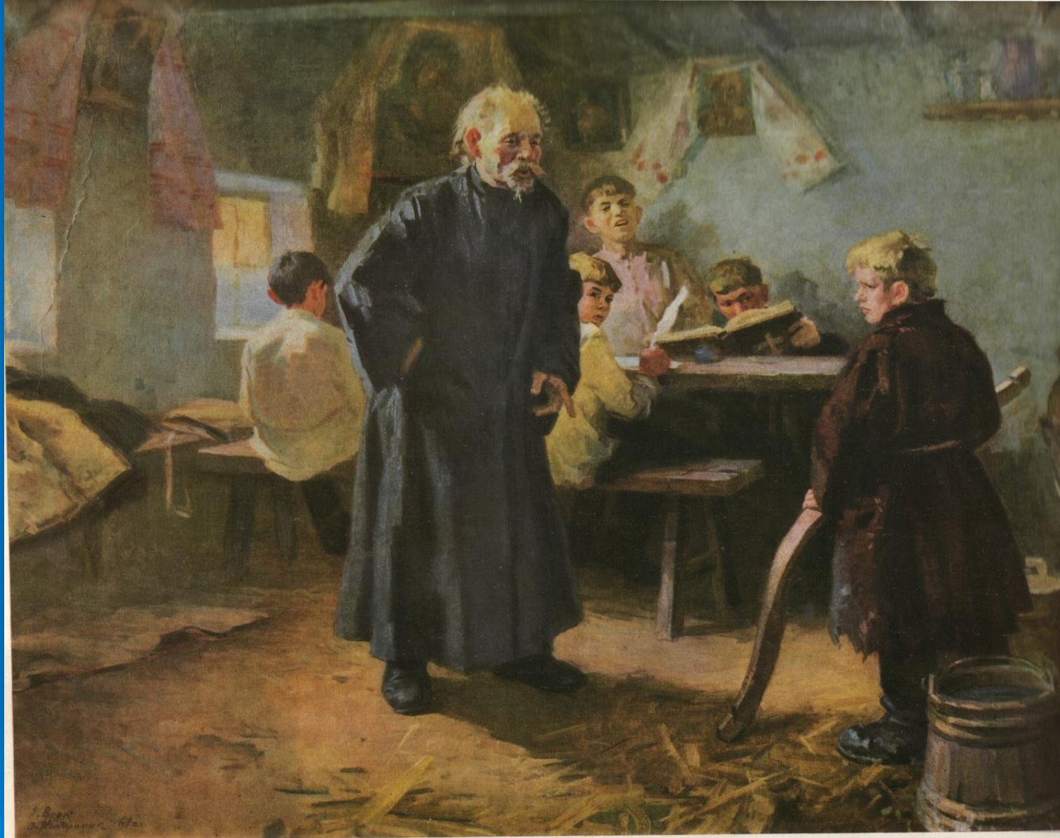
І. Гончара. “Тарас - водоноша”