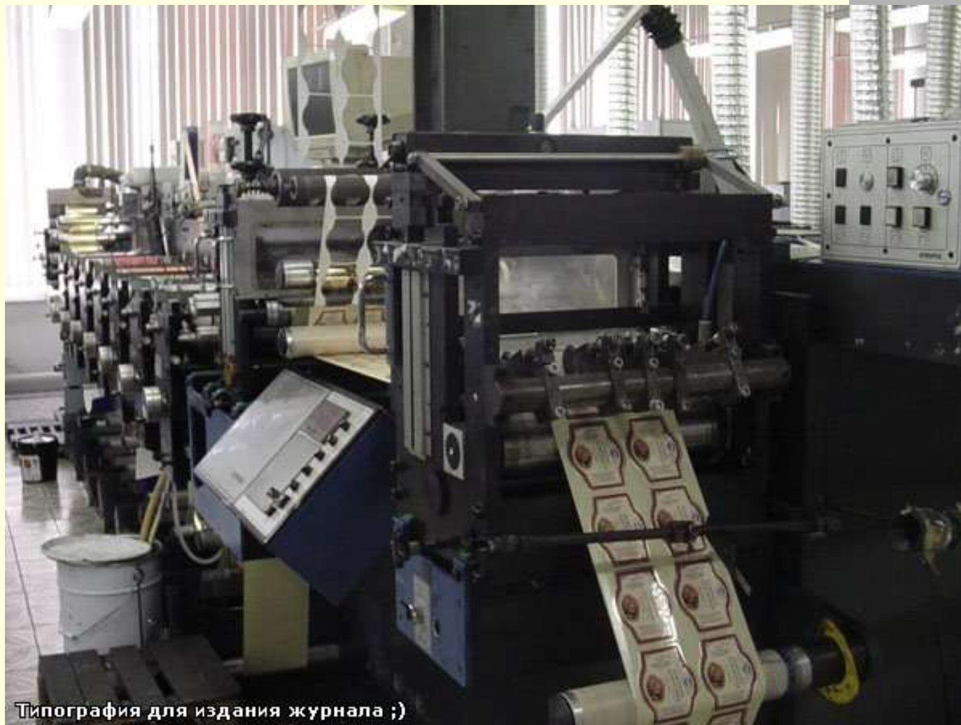
Тіпографія для издания журналу ;)