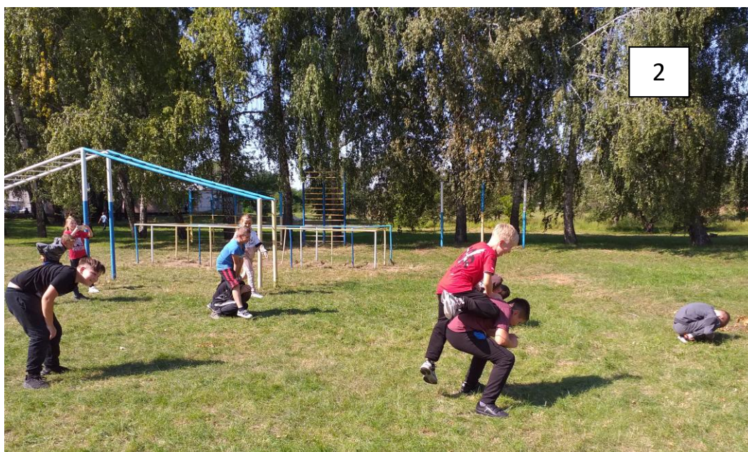
День фізичної культури і спорту. Спартакіада української народної (рої 1-3кл.). Гра «Гопак».