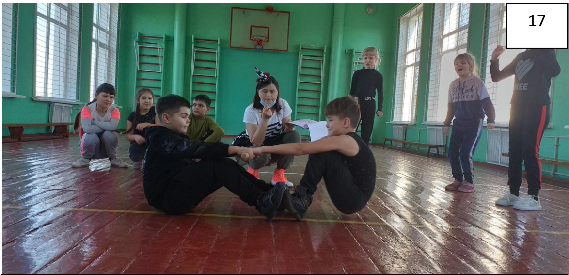
Зустріч Нового року. Новорічні вітання Діда Морозко і Снігуроньки. (для школярів 5-11 кл.)