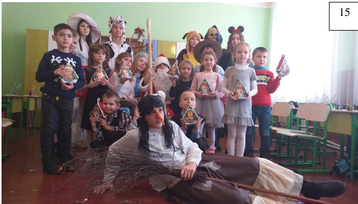
Зустріч Нового Року. Святкова програма «Баба Яга на рік Тигра 2022 (для учнів 1-4 кл.)