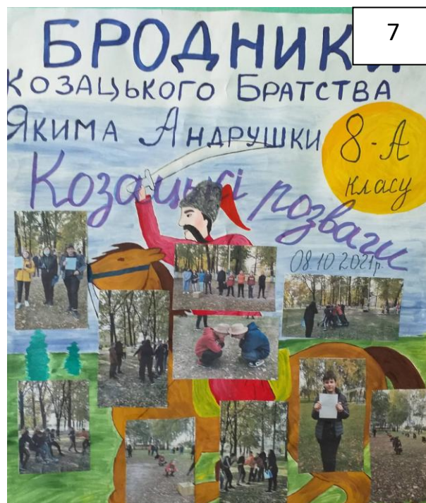
День українського козака. Конкурсна програма «Козацькі ігрища» (для роїв 8-9 класів). Козацька га «Лави на лаву»