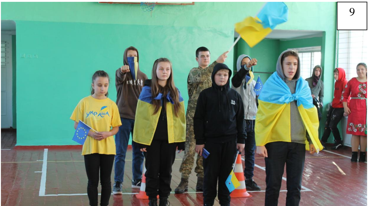
День Гідності і Свободи. Хвилина мовчання з перформансом «Прагнення свободи пробуджує гідність»(для учні 7-А,8-Б,9-Б кл.)