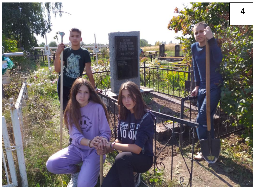
Операція «Братня могила»