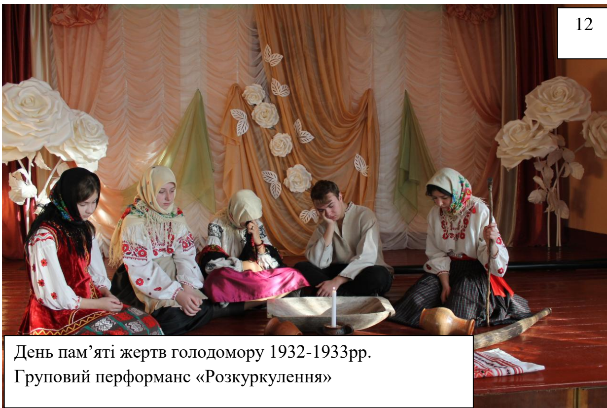
День пам'яті жертв голодомору 1932-1933рр. Груповий перформанс «Розкуркулення»