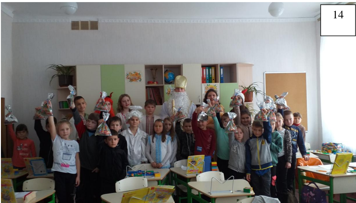
День Миколая Чудотворця. Свято «Затамуйте друзі подих - Миколай сьогодні ходить!» (для учнів 1-4 кл.)