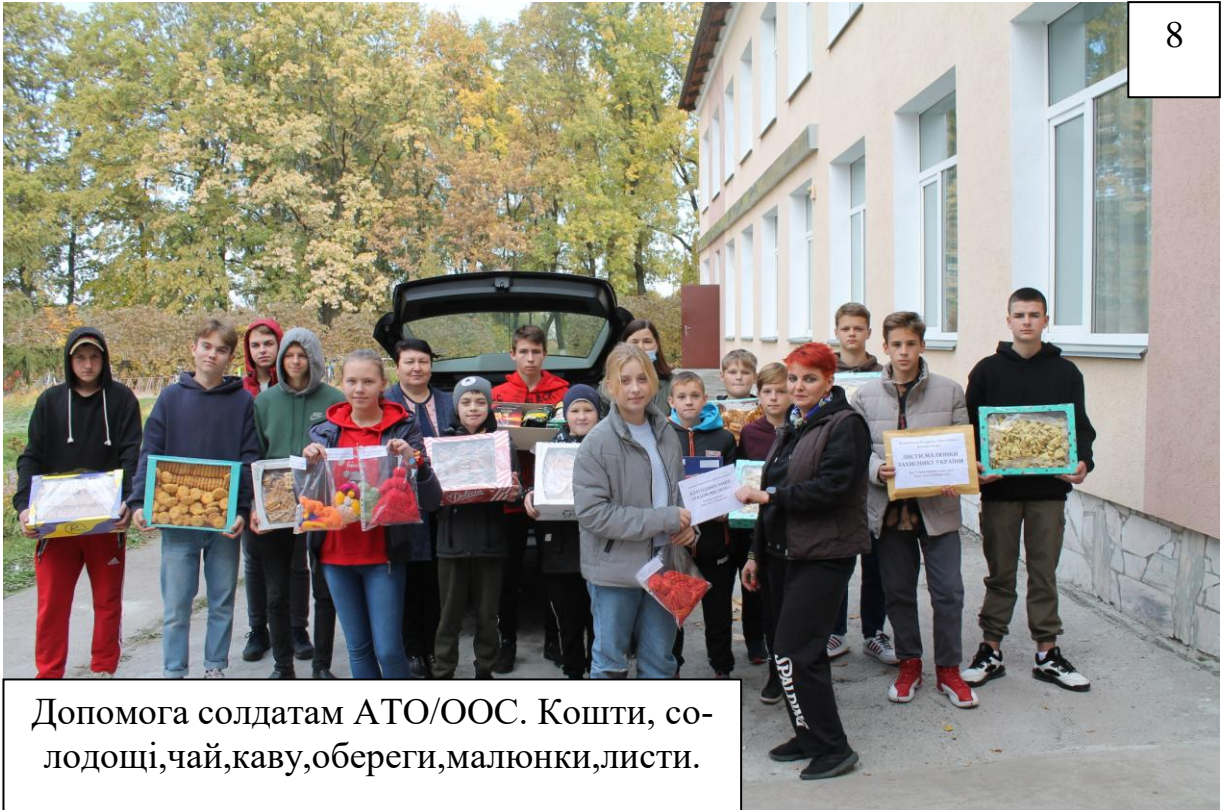
Допомога солдатам АТО/ООС. Кошти, солодощі, чай, каву, обереги, малюнки, листи.